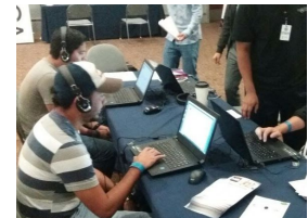
Experiencia de Usuarios en el Sistema GCP

Con la importancia que cobra hoy en día la acreditación ética, su institución y aspirantes de becas de apoyo podrán agregar esta dimensión al programa actual. Asociar el desempeño ético a la asignación de recursos institucionales permite afianzar su compromiso a los valores que su academia profesa, de manera tangible, clara y pública. Transmite un poderoso mensaje a sus estudiantes y sin duda, a su propio entorno. Conozca las variables con las que puede asignar este procedimiento !